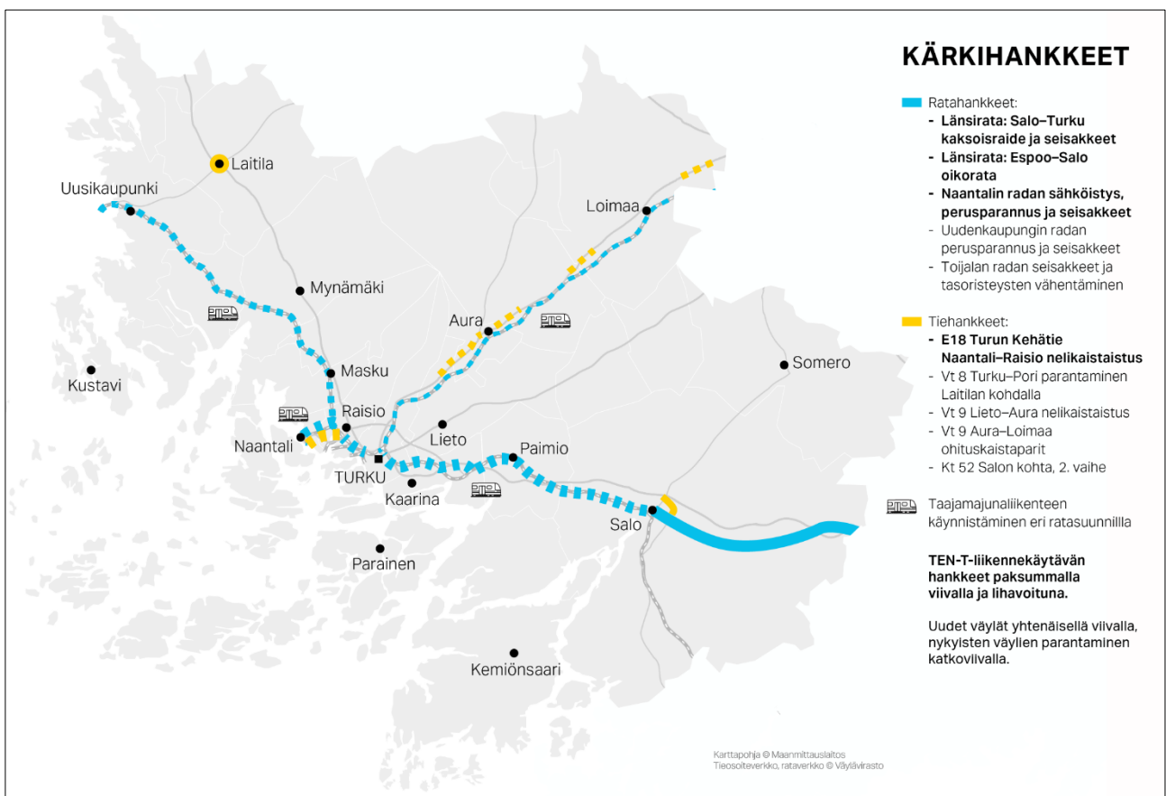
Kuva 4: Varsinais-Suomen liikennejärjestelmän suuret kärkihankkeet.

Varsinais-Suomen aluekehitystavoitteena on Turun ja muiden seutukuntien työssäkäyntialueiden yhdistäminen koko maakunnan laajuiseksi vahvaksi työ- ja asuntomarkkina-alueeksi. Samoin tavoitteena on maakunnan keskusten kytkeminen kiinteäksi osaksi eteläisen Suomen kaupunkiverkosta ja tiivistä työelämän vuorovaikutuksen vyöhykettä. Tavoite edellyttää keskuksia yhdistävien liikenneyhteyksien palvelutason kehittämistä. Samalla tavoitteena on hillitä henkilöautoliikenteen kasvua, mikä edellyttää keskusten välisten juna- ja linja-autoyhteyksien suhteellisen kilpailukyyn selvää parantamista.