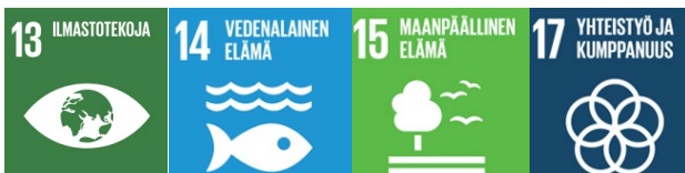
Taulukko 1: Ohjelmakauden 2026–2029 tavoitteet ryhmiteltynä kärkitavoitteiden alle.

Varsinais-Suomessa strategian kärkitavoitteet ja maakuntaohjelmatyö kytketään myös YK:n yhteisen Agenda 2030-toimintaohjelman kestävä kehityksen tavoitteiden toteuttamiseen. Näiden globaalien tavoitteiden toteutuminen edellyttää, että tunnistamme alueilla ja paikallisesti sekä elintapojemme vaikutukset, että tuotettavien ja kulutettavien tuotteiden vaikutukset koko niiden elinkaaren aikana. Kaikki Varsinais-Suomen strategian kärkitavoitteet tukevat terveisiin elinympäristöihin liittyviä tavoitteita 13,14,15 sekä yhteistyön ja kumppanuuden tavoitetta 17. Näiden lisäksi kärkitavoitekohtaiset kestävä kehityksen tavoitteet mainitaan seuraavissa luvuissa.